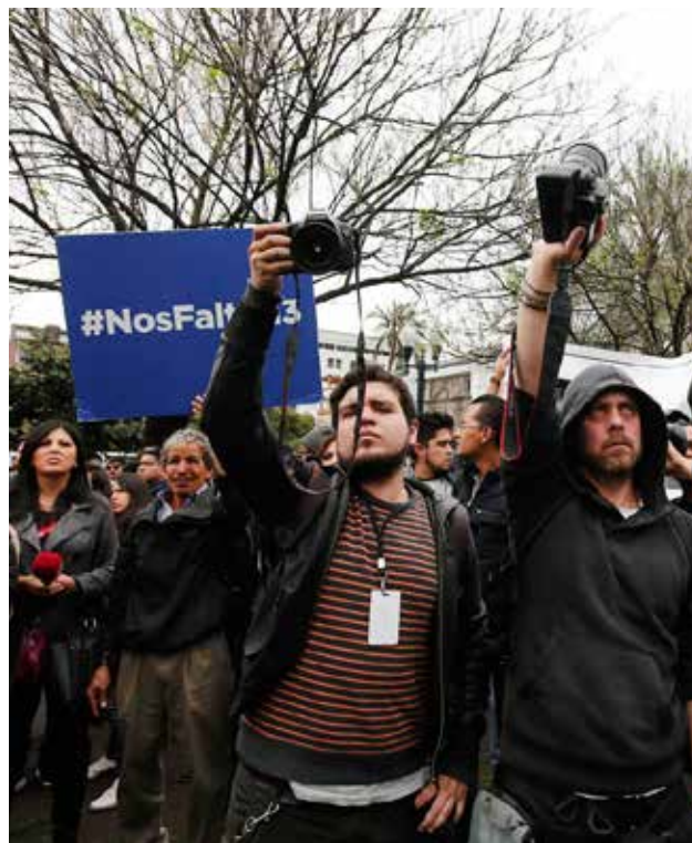
Amigos y compañeros de los periodistas protestaron.

La AEDEP ha estado presente en diversos espacios académicos: Universidad Técnica de Ambato, Universidad del Chimborazo, Universidad del Azuay, Universidad Católica de Ibarra, Universidad Técnica del Norte, Universidad Católica de Guayaquil, Universidad de Guayaquil, Universidad San Gregorio de Portoviejo, Universidad de las Américas, Universidad Andina Simón Bolívar, Facultad Latinoamericana