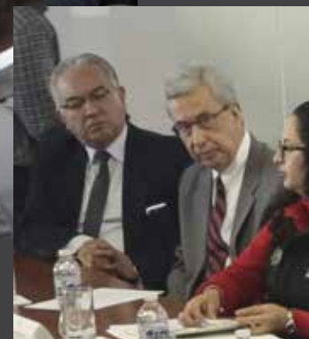
la AEDEP participó de manera activa en la discusión del proyecto de reformas a la ley de comunicación en la Asamblea Nacional

“La libertad de expresión se la construye todos los días, nunca se la consigue de rodillas, sino de pie porque es nuestro derecho. Es un tema de ejercicio de la ciudadanía en democracia”.