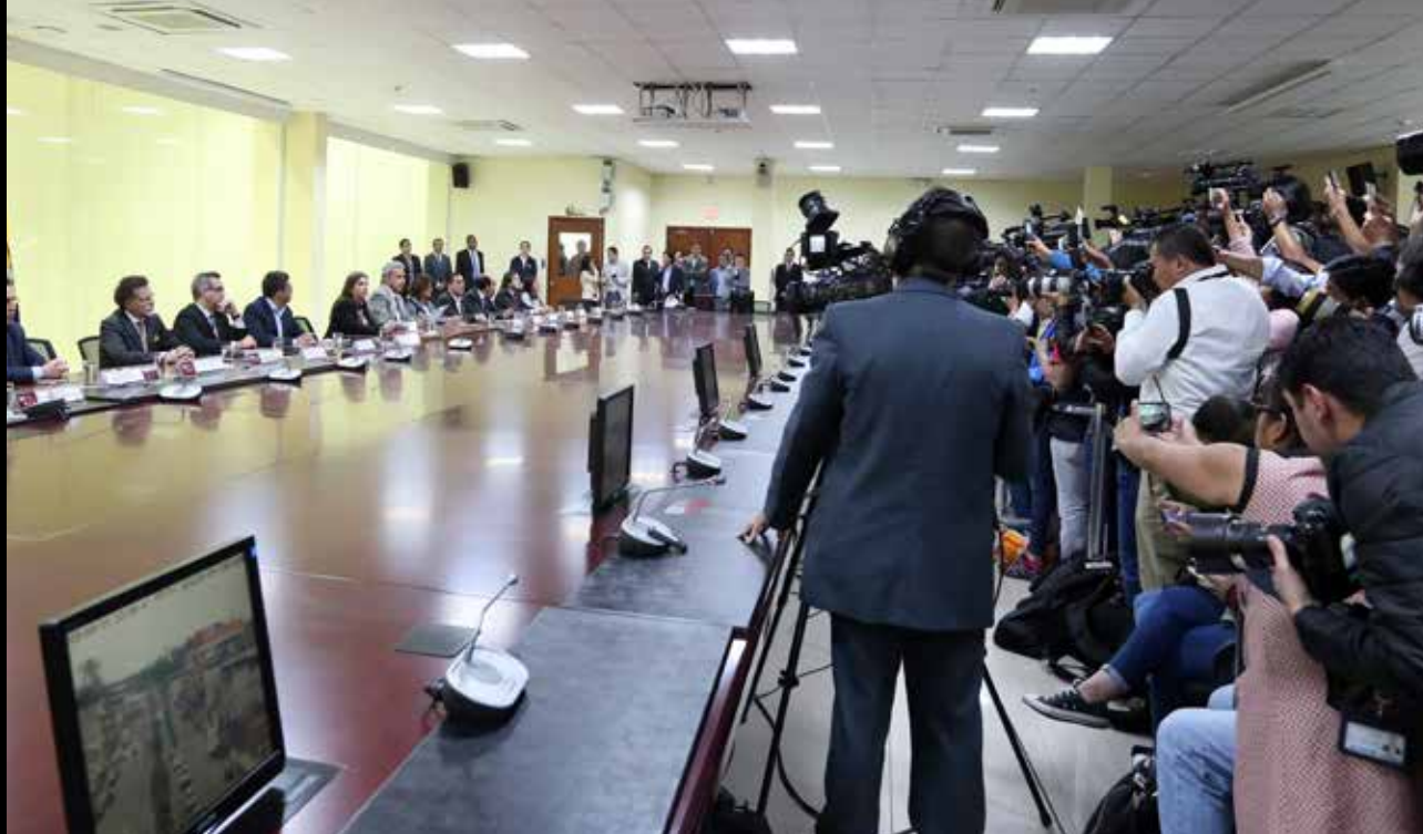
Cobertura informativa del secuestro y posterior asesinato del equipo periodístico de Diario El Comercio

cuando sus Fuerzas Armadas adquirieron helicópteros también defectuosos e inservibles. Esto permitió la infiltración de grupos delincuenciales a través de una frontera casi completamente permeable.